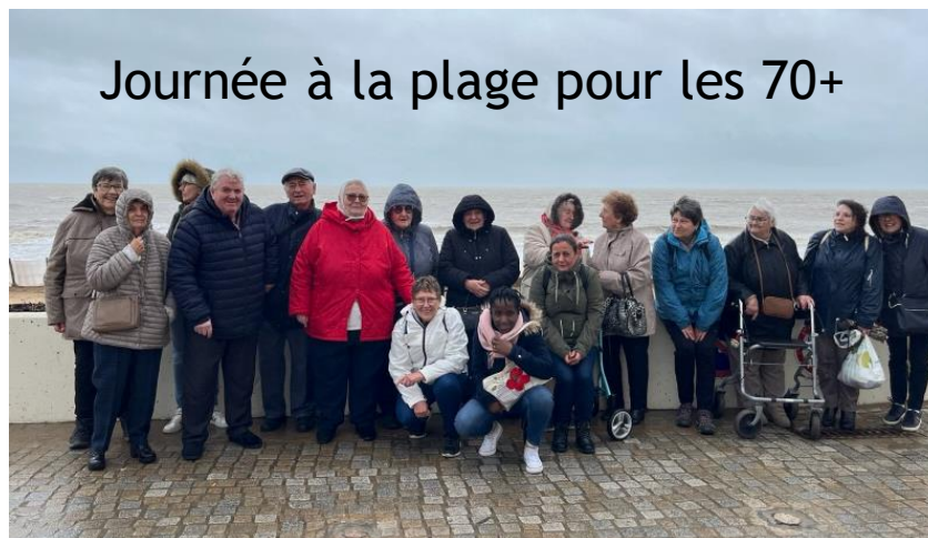
Journée à la plage pour les 70+